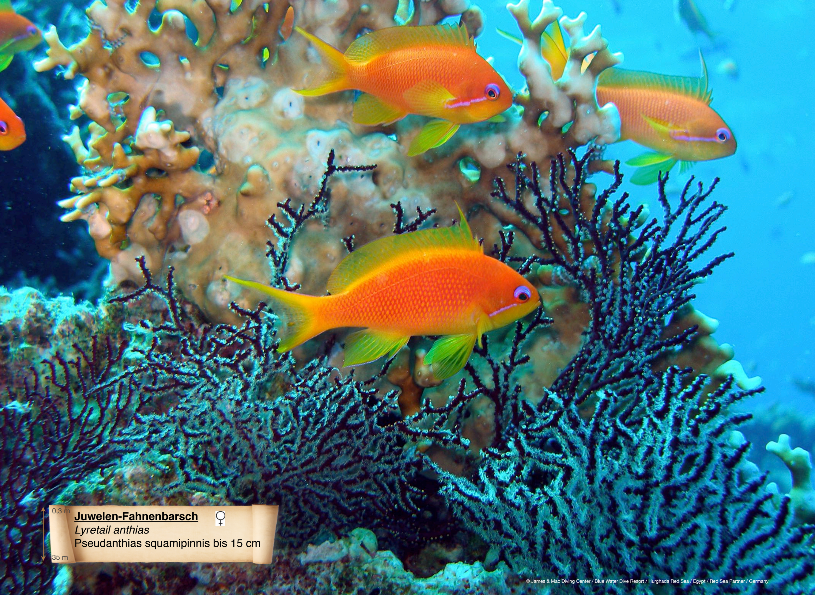
0,3 m Juwelen-Fahnenbarsch ♀ Lyretail anthias Pseudanthias squamipinnis bis 15 cm 35 m