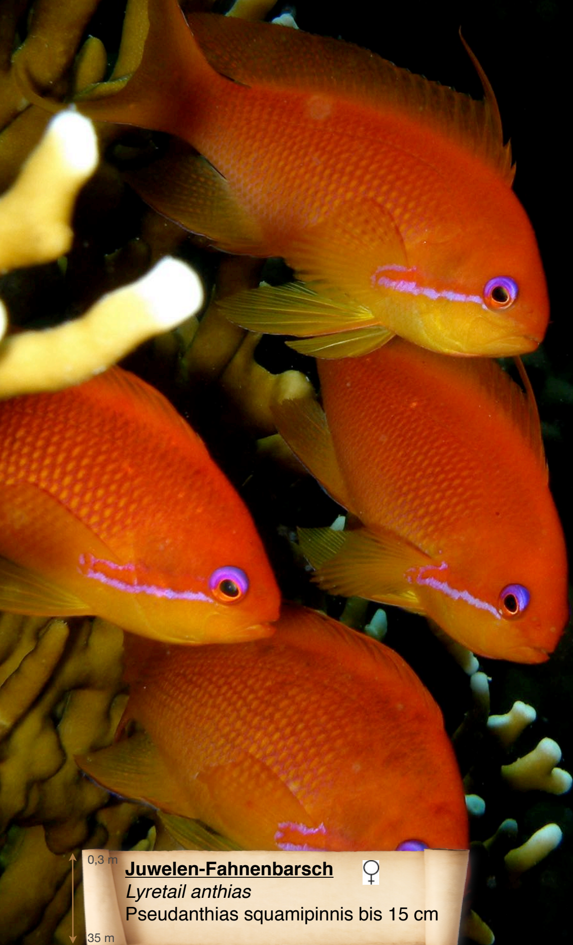
0,3 m Juwelen-Fahnenbarsch ♀ Lyretail anthias Pseudanthias squamipinnis bis 15 cm 35 m