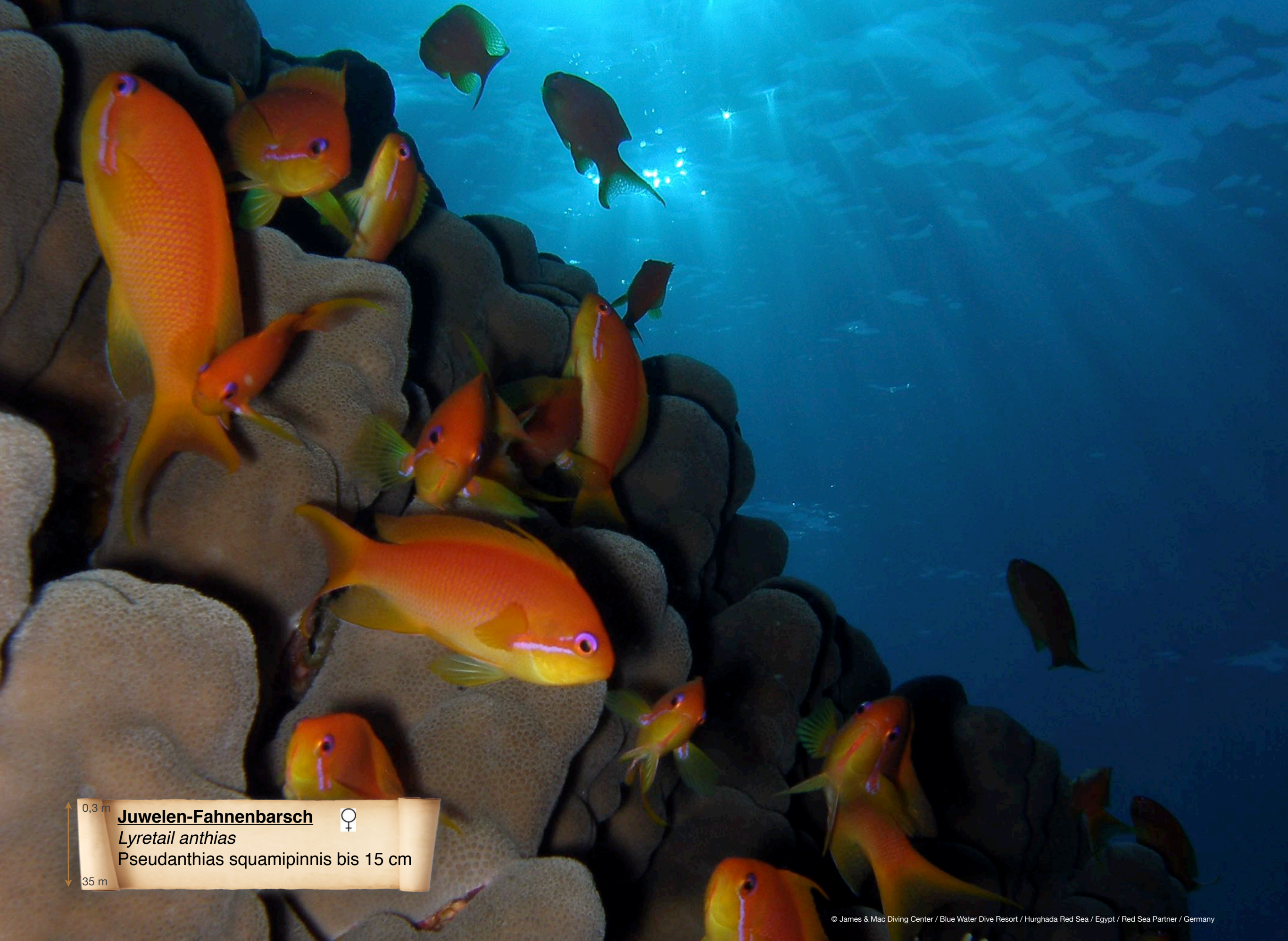
0,3 m 35 m Juwelen-Fahnenbarsch ♀ Lyretail anthias Pseudanthias squamipinnis bis 15 cm