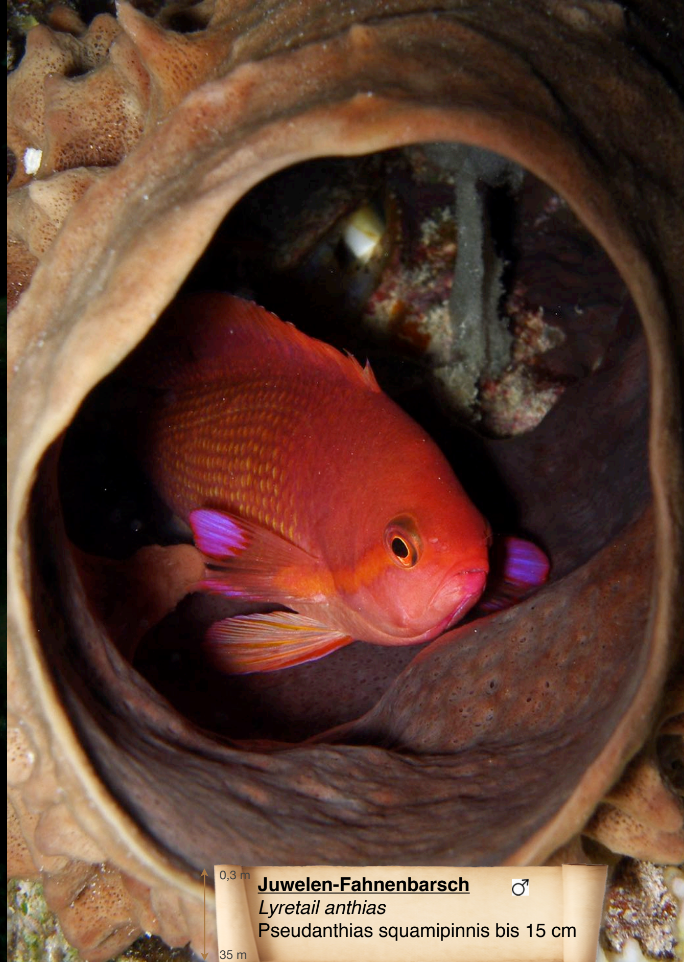
0,3 m Juwelen-Fahnenbarsch ♂ Lyretail anthias Pseudanthias squamipinnis bis 15 cm 35 m